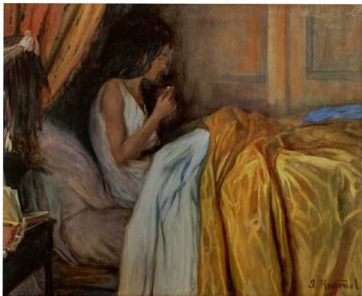
Santiago rusinol before the morphine