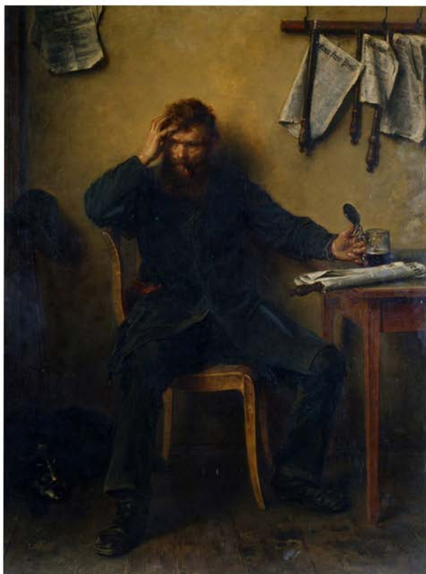
Ludwig Knaus – Der Unzufrieden