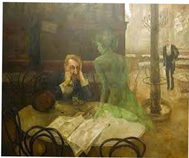
The Absinthe Drinker by Viktor Oliva