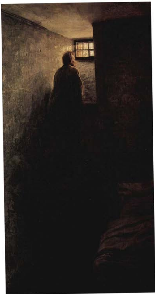
Nikolaj Alexandrowitsch Jaroschenko